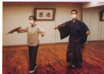
仕舞のお稽古風景