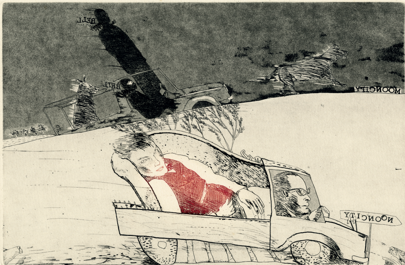
「From Noon to Moon」1979年/「CAPOTE SUITE」シリーズ/etching+aquatint

Print Exhibition Encountering World Literature-From Capote to Murakami